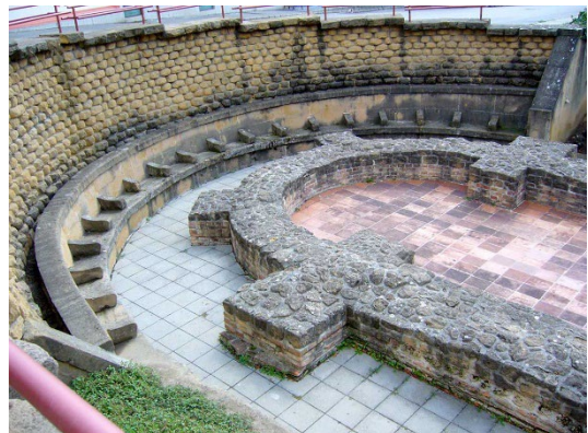
Pécsi Ókeresztény sírkamrák